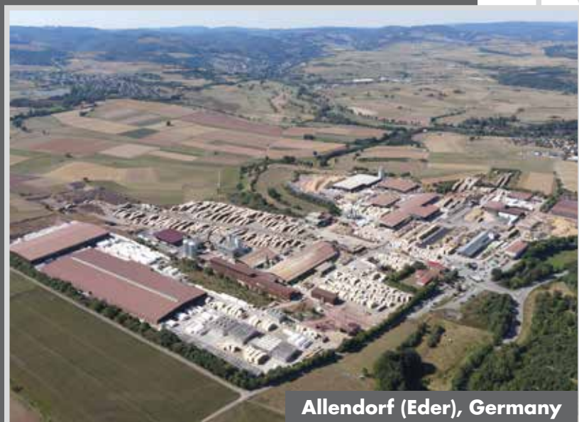
Allendorf (Eder), Germany